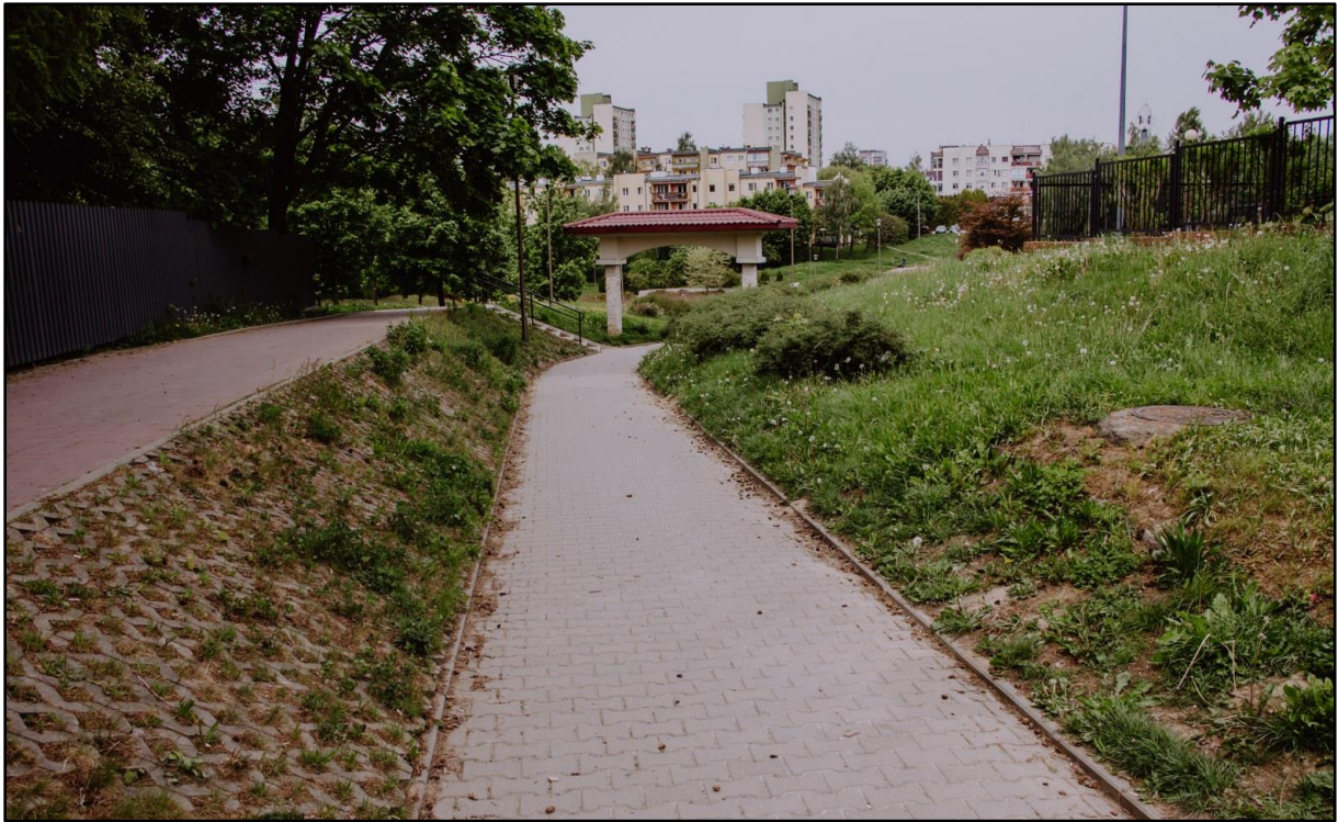
Na końcu chodnika pomiędzy szkołą a parafią jest charakterystyczny łuk .