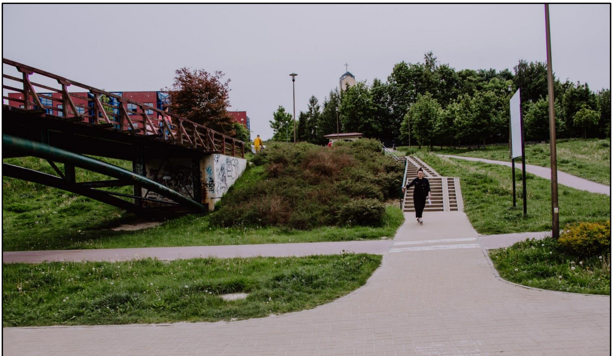
Tuż za łukiem są dwa ciągi schodów z pochylnią .